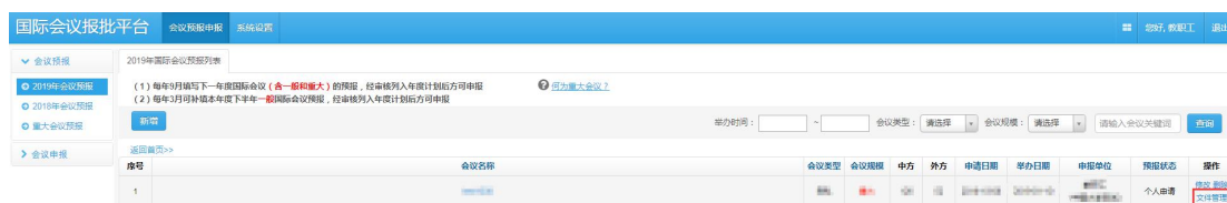
图 2.2.1 国际会议预报列表-文件管理页面

国际会议预报申请提交后，点击预报列表操作栏的文件管理，如图 2.2.1，进入 文件列表 页面如图 2.2.2，点击“ 下载 ”按钮下载国际会议预报申请表（部分内容和格式根据实际需要修改）， 打印签字盖学院公章扫描后待用 。