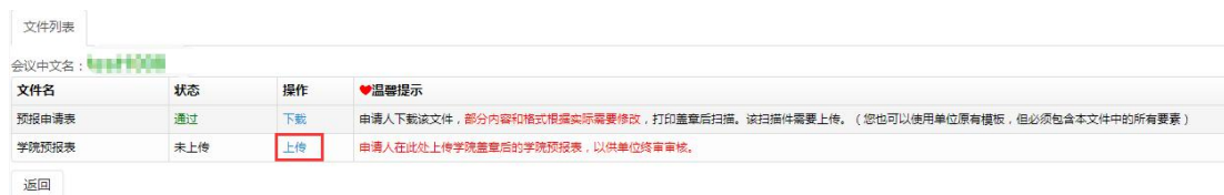
图 2.2.3 文件列表学院预报表上传页面

国际会议预报表 下载、打印签字盖学院公章扫描后 ，需要将扫描件上传，点击“ 上传 ”按钮 上传学院预报表 （国际会议预报申请表签字盖章的扫描件），如图 2.2.3。 注：在单位初审审核之前可以修改上传的扫描件。