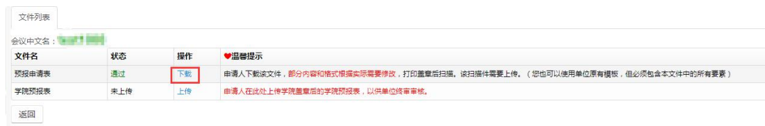
图 2.2.2 文件列表预报申请表下载页面

国际会议预报表 下载、打印签字盖学院公章扫描后 ，需要将扫描件上传，点击“ 上传 ”按钮 上传学院预报表 （国际会议预报申请表签字盖章的扫描件），如图 2.2.3。 注：在单位初审审核之前可以修改上传的扫描件。