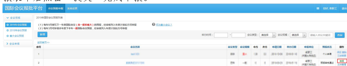
图 3.1 国际会议预报到申报

国际会议预报教育部审核通过后，用户可以进行国际会议申报。步骤是：点击会议预报申报--》2019年会议预报--》进入预报列表点击对应会议操作栏中的“申报”按钮，如图 3.1，即进入国际会议申报流程。按要求填写国际会议申报表单后点击“提交”完成申报。