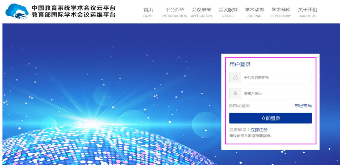
图 1.3 主平台登录界面

第二步： （注册成功后系统自动回到“中国教育系统学术会议云平台”）点击“登录”进入主平台登录界面如图 1.3，输入注册的账号和密码点击“立即登录”。