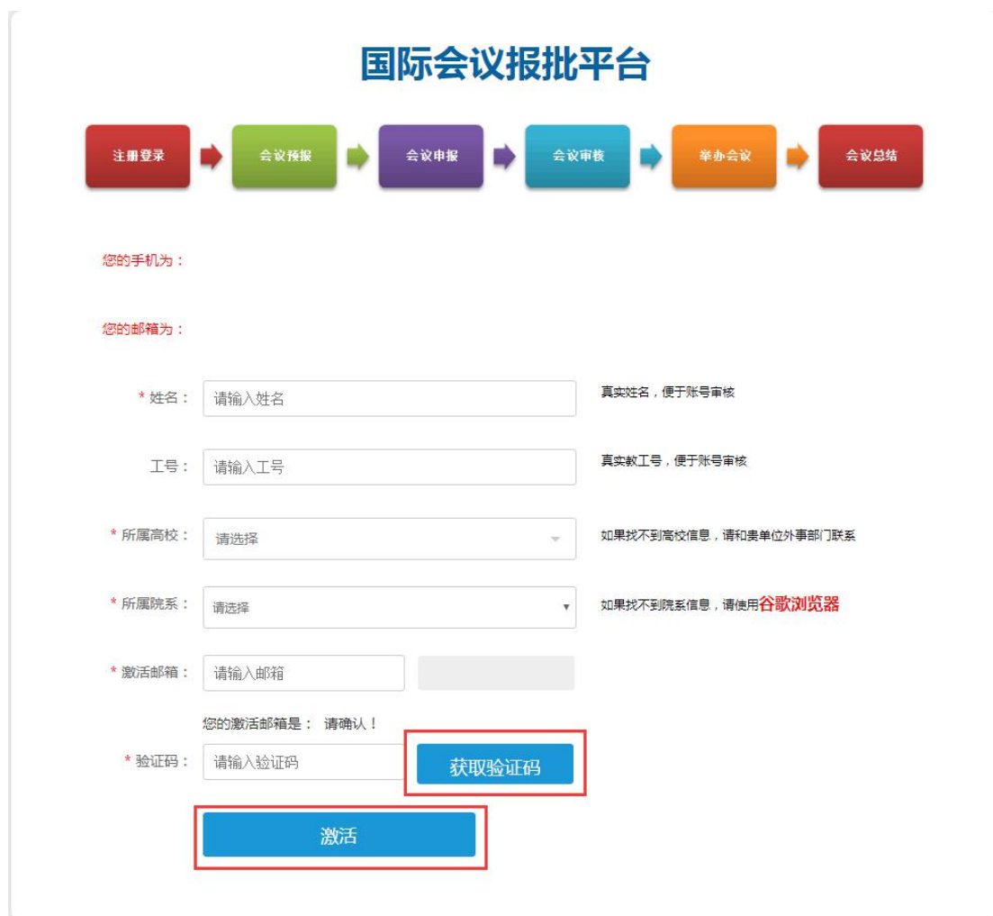
图 1.4 国际会议报批平台激活页面