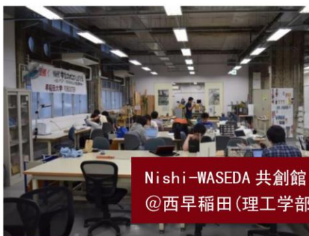
Nishi-WASEDA 共創館 @西早稻田(理工学部) キャンパス