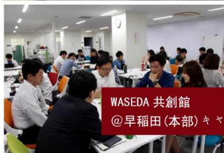
WASEDA 共創館 @早稻田(本部) キャンパス